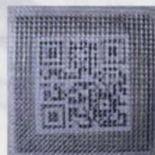
④ ガラス繊維シート設置