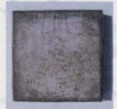
② 素地のコーティング